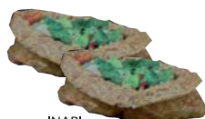
INARI friterad tofu