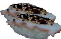
BLÄCKFISK 8/10 ARMAD